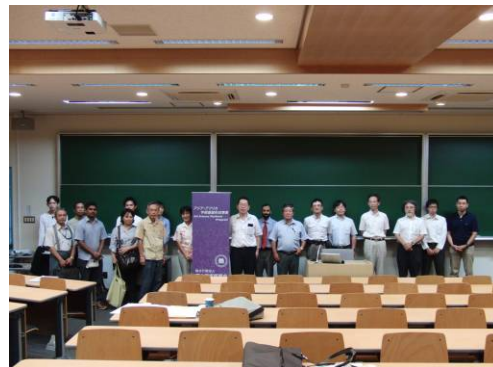
参加者による記念撮影