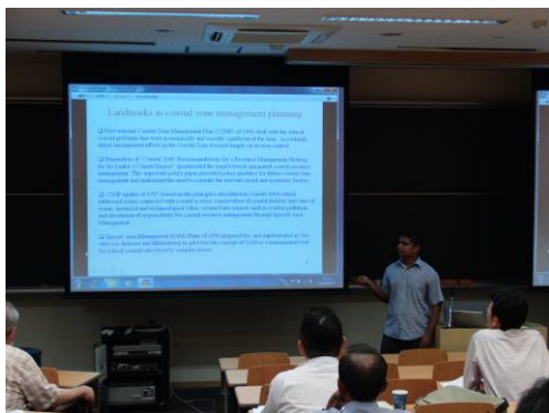
埼玉大学博士後期課程学生による発表