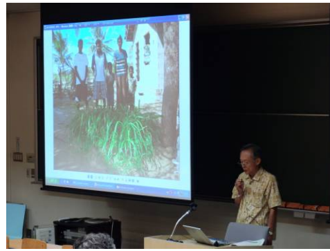
和光大学澁谷教授による発表 (パネルディスカッション)